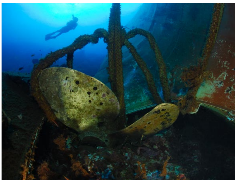
Her en der liggen onderdelen van het wrak verspreid.

Een stipje boven Palermo, meer is het niet. Maar zo klein als het eiland is, zo groot is de diversiteit onder water. duiken neemt je mee naar Ustica, een van de topduiklocaties van Italië.